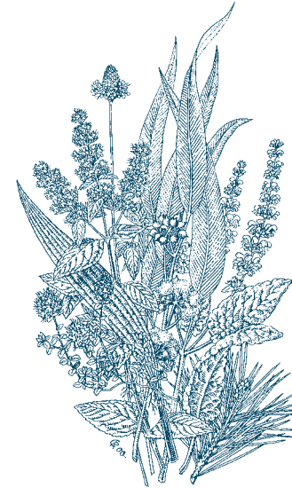
Heilpflanzen im WALA-Garten