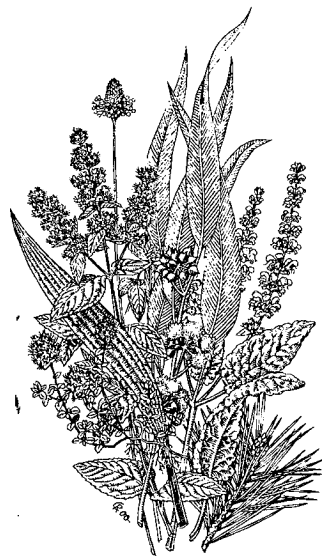
Heilpflanzen im WALA-Garten